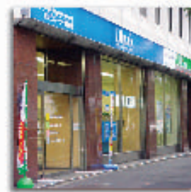
CP communication plaza コミュニケーションプラザ日本橋