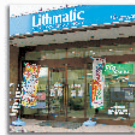
CP communication plaza コミュニケーションプラザ虎ノ門