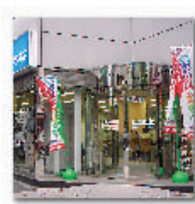
CP communication plaza コミュニケーションプラザ神保町