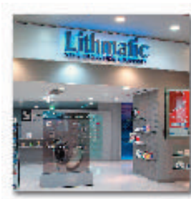
リスマチック カレッタ汐留